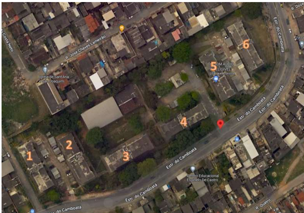
Figura 1: Conjunto Habitacional Recanto do Camboatá, Costa Barros - RJ

Este Projeto Básico estabelece condições técnicas para a contratação de empresa especializada para prestação de serviço de “Execução de Serviços de Reforma no Conjunto Habitacional Recanto do Camboatá, localizado na Estrada do Camboatá, 3953 - Costa Barros, Rio de Janeiro – RJ” . Foi elaborado conforme os requisitos do artigo 11 do Decreto estadual nº 46.642/2019.